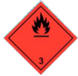
RÓTULO DE RISCO PRINCIPAL

produtos da subclasse 1.4 grupo de compatibilidade S. Incompatível com a subclasse 4.1+1 (substâncias auto reagentes que contêm o rótulo de risco subsidiário de explosivo) e com a subclasse 5.2 +1 (peróxidos orgânicos que contêm o risco subsidiário de explosivo).